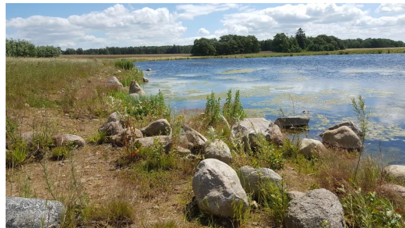
Bevattningsdamm norr om Harlösa