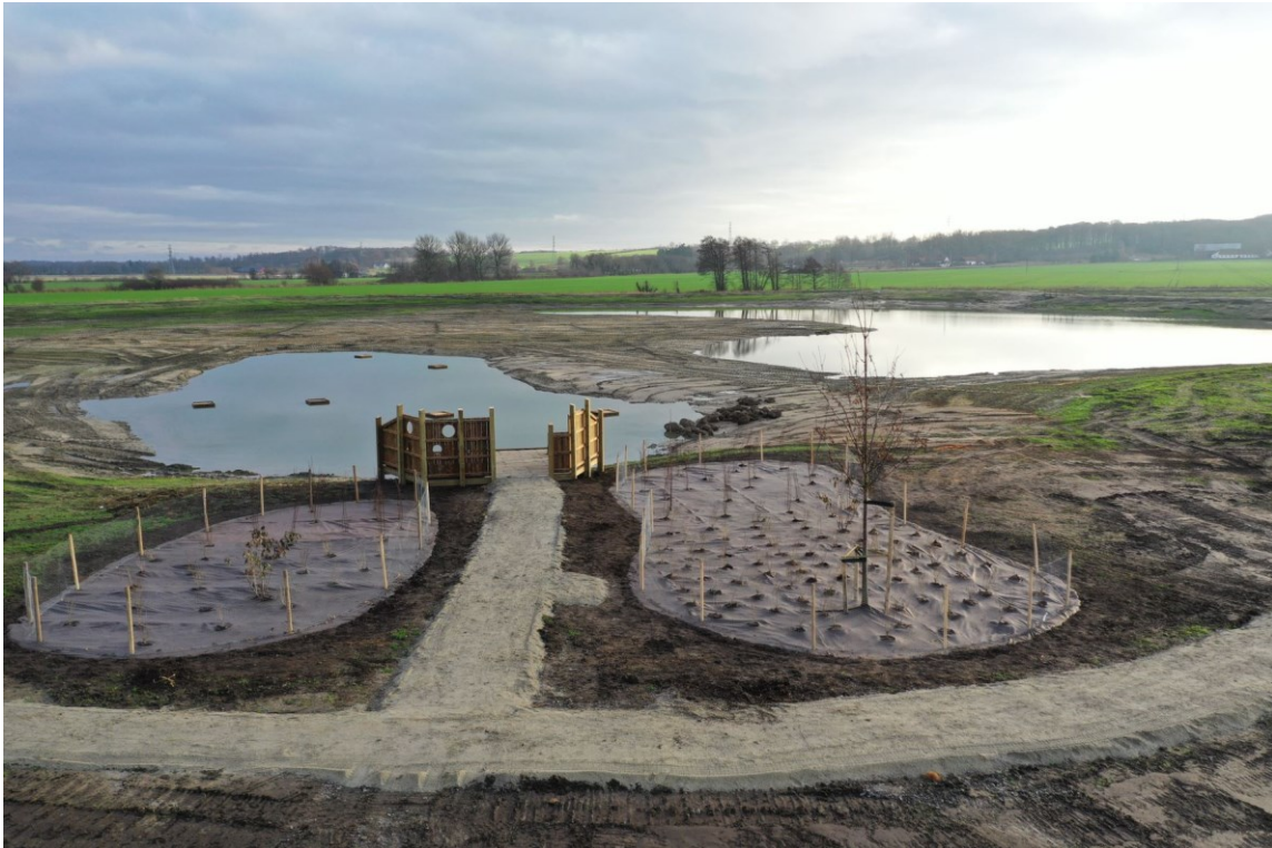
Figur 3 Åtgärder för rekreation vid våtmarken. En utsiktbrygga med vy över ett djupområde och en grund del av den östra våtmarksdelen. I djupdelen är fågelplattformar utplacerade.

variation av grund och djupområden vilket ska ge en varierad miljö för etablering av vattenanknutna djur och växter. Totalt kommer ett område på ca 15 ha att tillgängliggöras för rekreation och insådd av örtblandningar samt en sandyta, som ytterligare kommer att gynna den biologiska mångfalden.