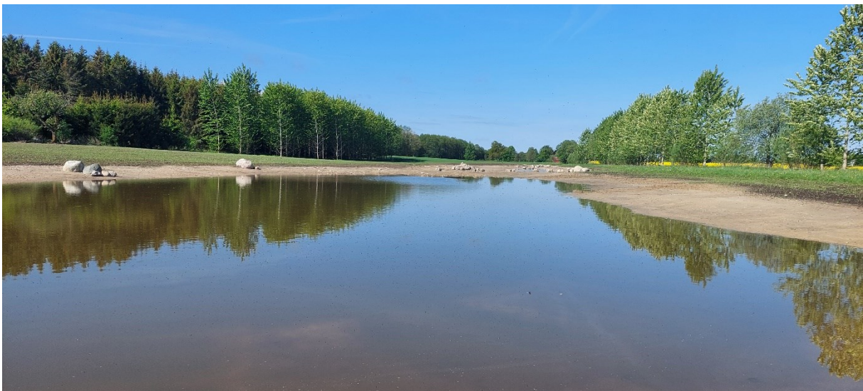
Figur 2 Vattenspegel vid lågvatten i våtmarken vid Oderup sett från öster.