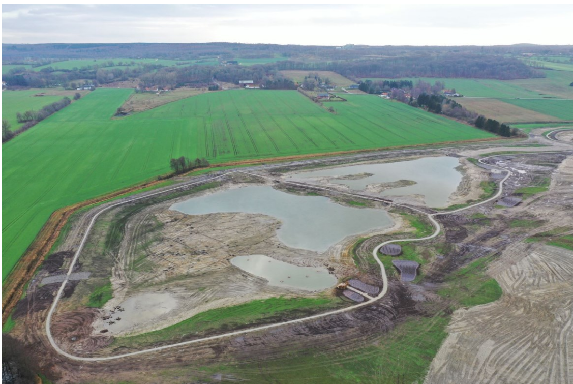
Figur 4 Vy över hela våtmarksområdet från nordost.