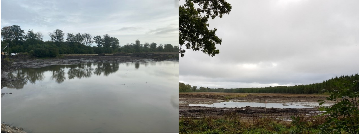
Figur 5 Vy över våtmarken under entreprenadarbeten.

En våtmark på ca 1–1,2 ha har färdigställts under våren 2022. Våtmarken kommer att variera i utbredning och höjd beroende på tillkommande flöde från ett större dike samt mindre dräneringar. Våtmarken har skapats genom schakt och dämning. Såväl syftet med näringsrening som biologisk mångfald och flödesdämning kommer att uppnås i denna våtmark.