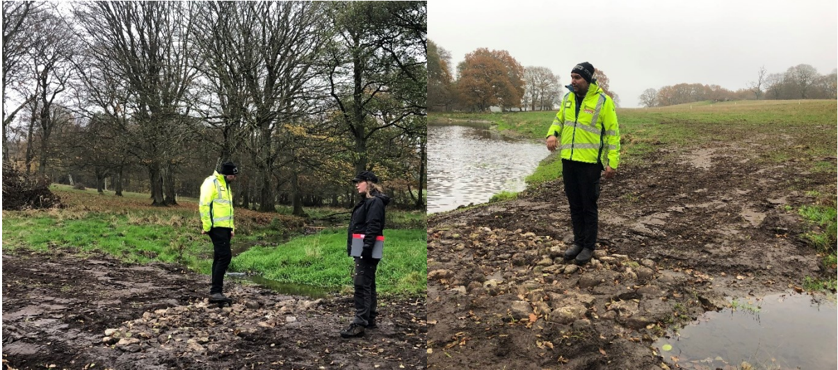
Figur 11 I det västra översvämningsområdet på Vanstadtorp 10:12 avleds vattnet direkt från en bäck (tv) till en delvis utgrävd översvämningsyta (th).