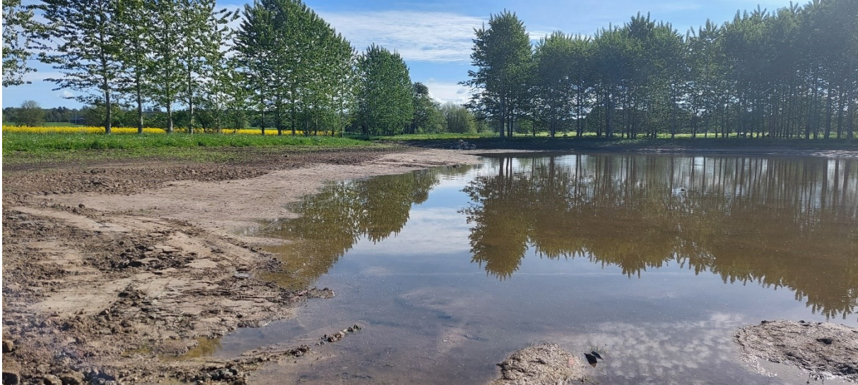
Figur 1 Vattenspegel vid lågvatten i våtmarken vid Oderup sett från väster.

En våtmark på ca 1 ha har färdigställt under våren 2022. Våtmarken kommer att variera i utbredning och höjd beroende på tillkommande flöde från intilliggande bäck. En mindre vattenspegel kommer att kvarstå i våtmarken under lågflöden och gynna den biologisk mångfalden. Vid högflöden kommer målet med en flödesdämpande effekt såväl som retention av näringsämnen att uppfyllas.