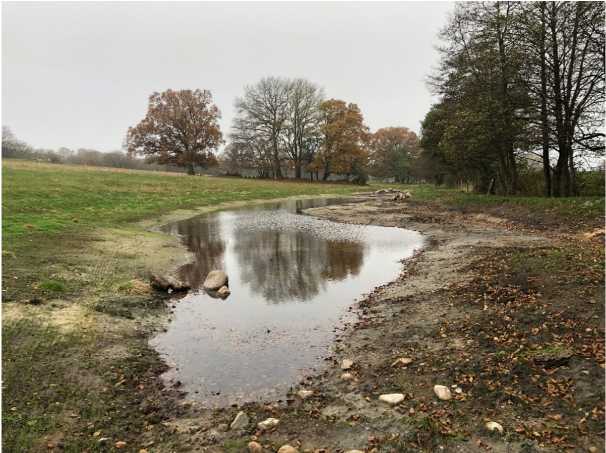
Figur 10 Den mindre dammen i det östra läget på Vanstadtorp dit inloppsanvisningen leder. Vattnet hålls kvar av en låg vall samt ett mindre plankdämme.