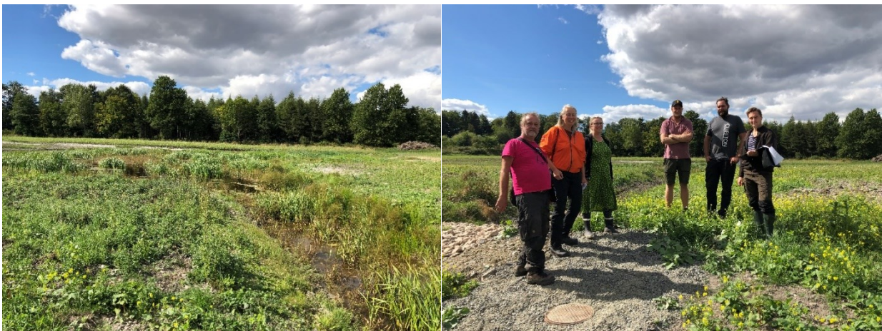
Figur 6 Vy över våtmarksområdet vid slutbesiktning i september 2022 (tv). Vid detta tillfälle var vattennivåerna låga. Deltagare vid slutbesiktning invid utloppsdämet.