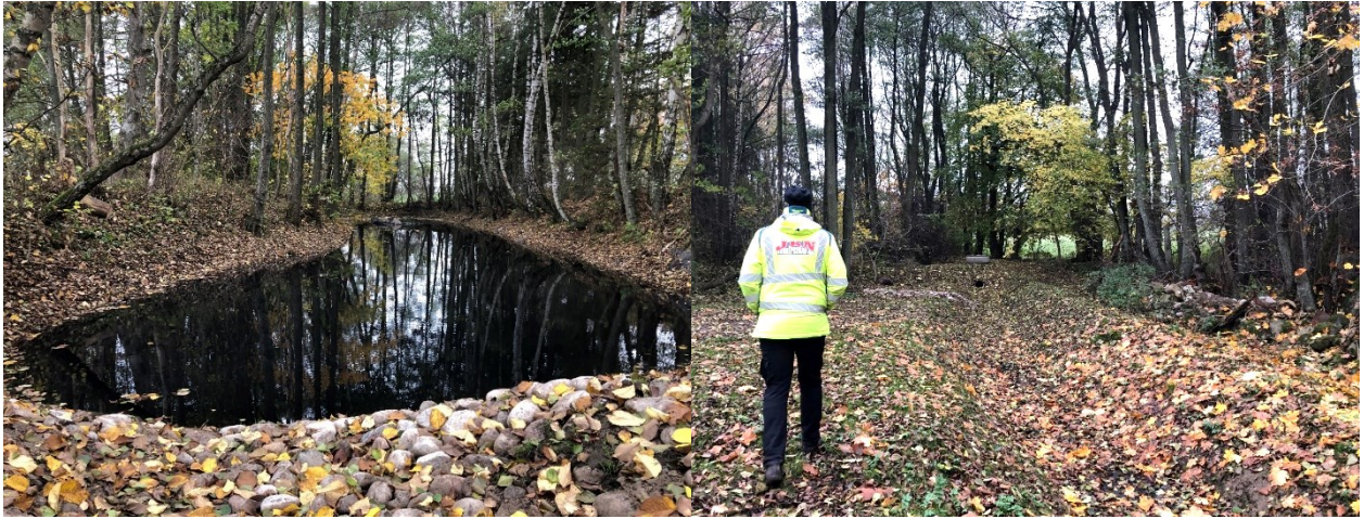
Figur 7 Vatten till den västra översvämningsytan leds från Vanstadsbäcken till en mindre damm (tv). Via en brunn leds vattnet vidare i en anvisning mot översvämningsytan (t.h.).