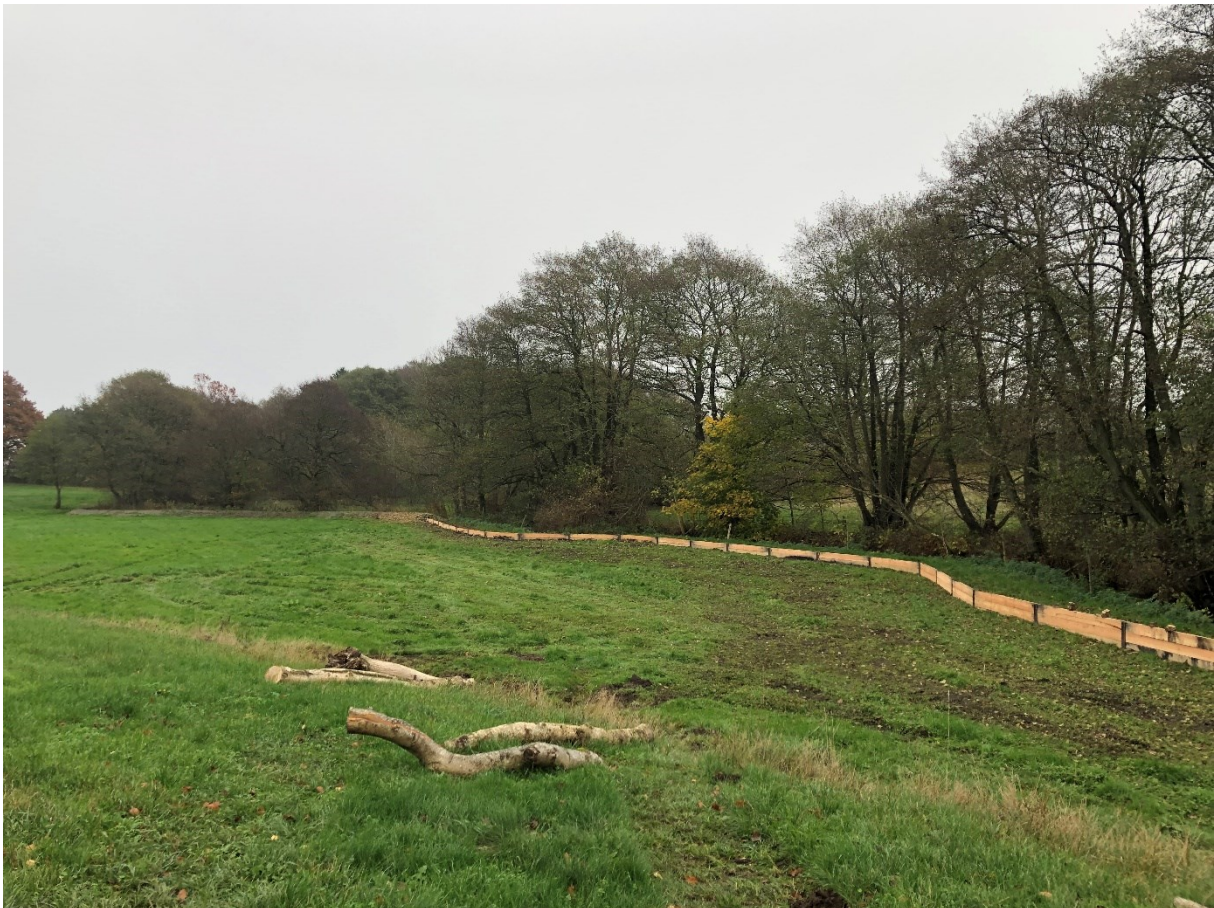
Figur 8 Via anvisningen når vattnet ett större översvämningsområde där det däms upp med ett plankdämme.