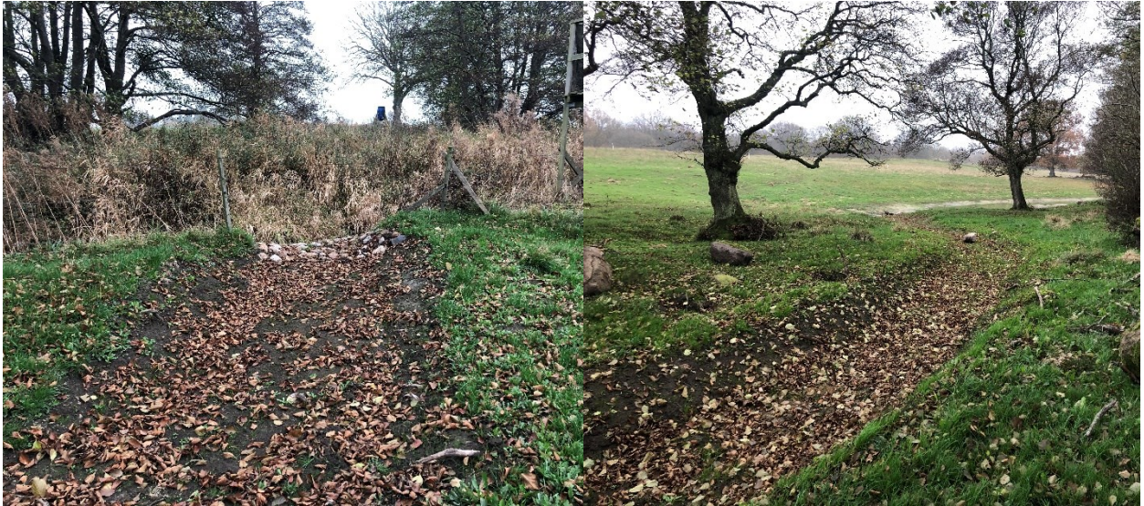
Figur 9 Östra delen av anläggningen på Vanstadtorp 10:12. Bilden visar inloppet från bäcken (tv) samt inloppsfåran mot den grävda dammen.