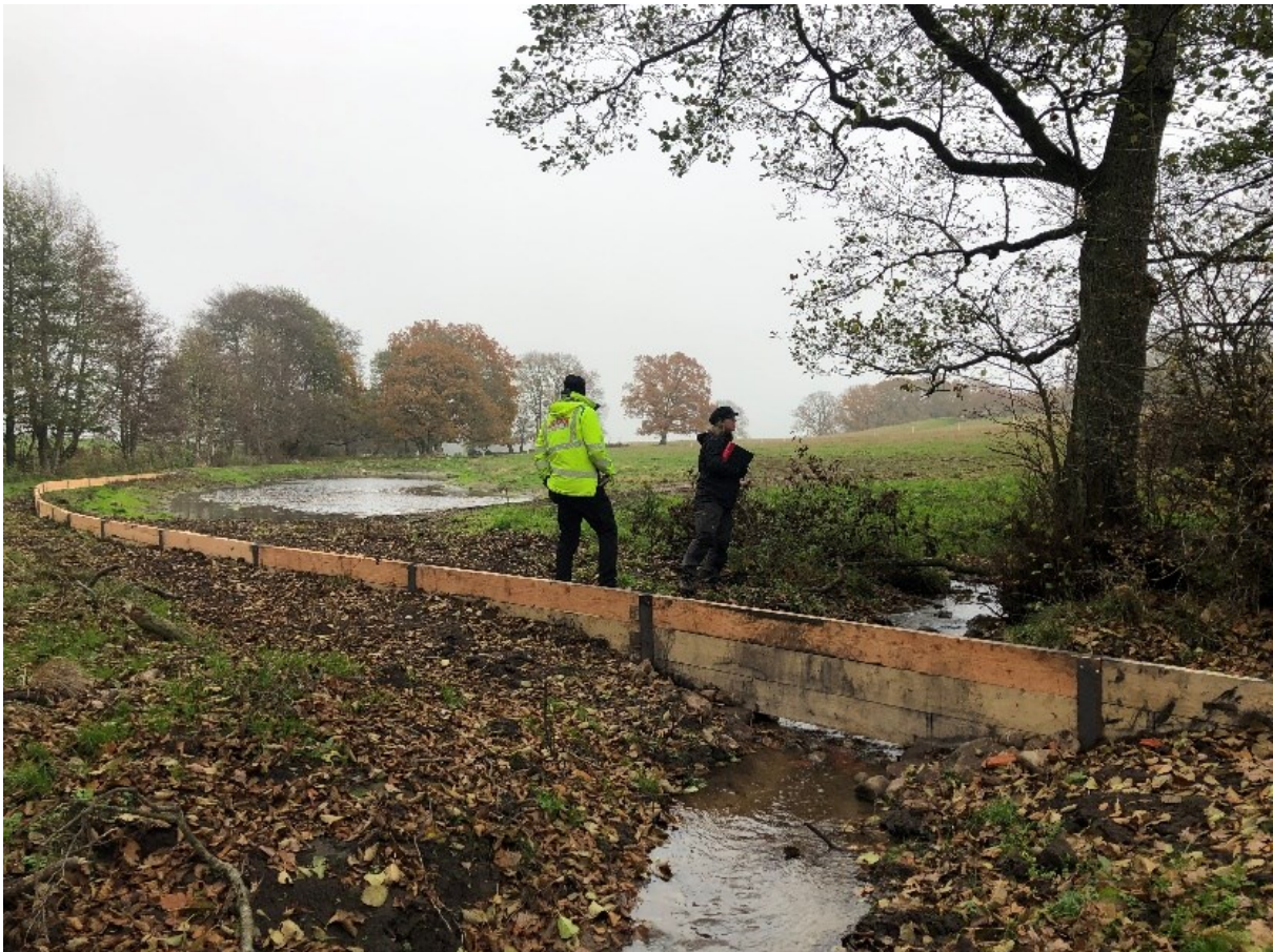
Figur 12 Vy över plankdämme och översvämningsyta på Vanstadtorp 10:12. Vid höga flöden sker en dämning av bäcken med hjälp av plankdämnet. Vid lägre flöden rinner vattnet under det dämmande planket.